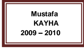
Mustafa KAYHA 2009 – 2010